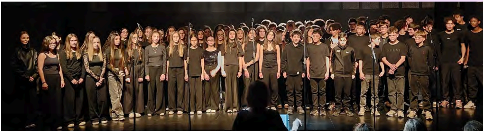
Photo de groupe des élèves de troisièmes pour le chant final