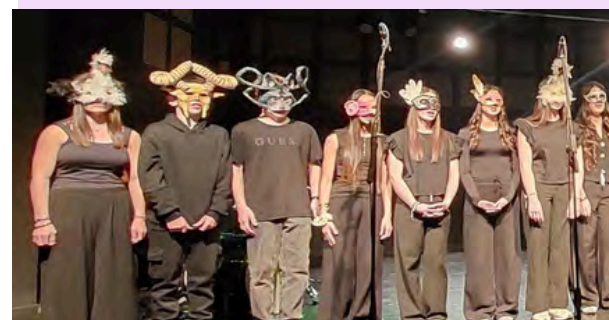
Photo des élèves masqués

Voir les autres photos sur le site de l'établissement : https://college-stlouis.fr/actualite/spectacle--metamorphose--des-troisiemes-