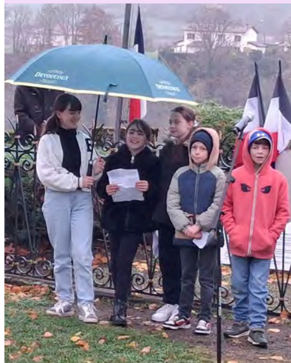
Photo des jeunes présents à la cérémonie le 16 novembre à Saint-Privat d'Allier