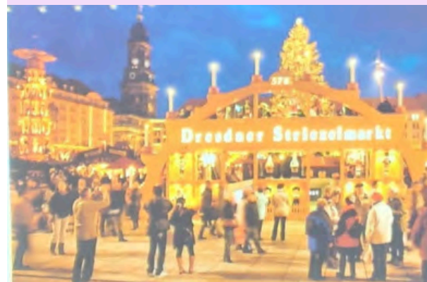
Photo de l'illustration du marché de Noël de Dresde intégrée à sa présentation. J. WENZEL

Voir l'article publié sur le site de l'établissement intitulé "Découverte allemande avec Judith pour les sixièmes" :