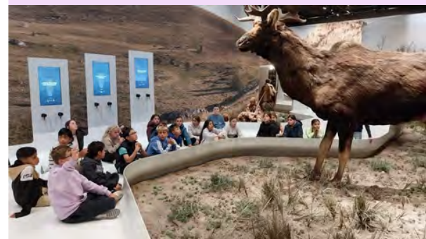
Visite de la reconstitution de la grotte Chauvet

Mercredi, ils ont fait un arrêt à la grotte Chauvet, où ils ont assisté à plusieurs ateliers : visite de la reconstitution de la grotte, tir à l'arc à la manière de la Préhistoire, poterie : réalisation d'animaux en terre cuite. Ensuite, ils ont pris le bus direction Arles où ils étaient logés à l'auberge de jeunesse.