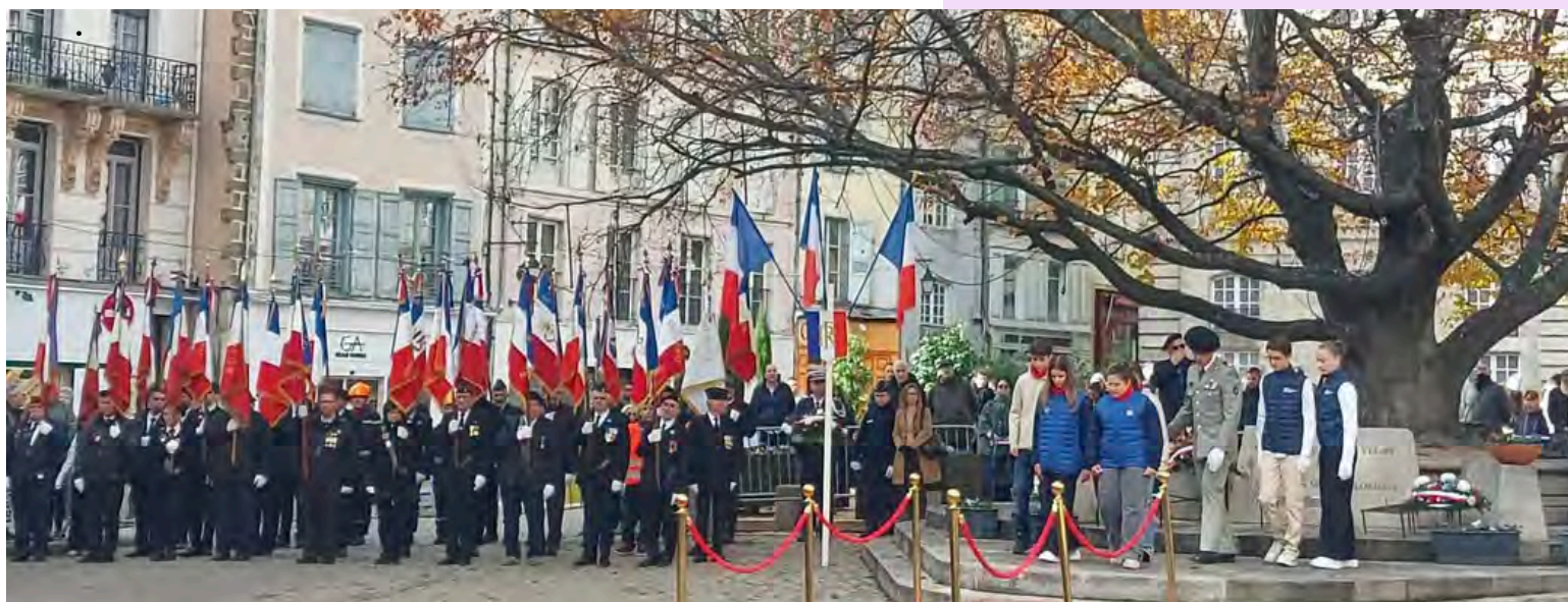
Photo des élèves du collège après le dépôt de gerbe à la cérémonie au Puy-en-Velay le 11 novembre 2025.