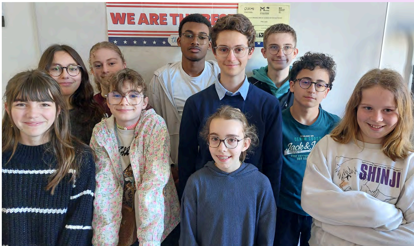
Photo de groupe prise au CDI jeudi 12 mars 2026