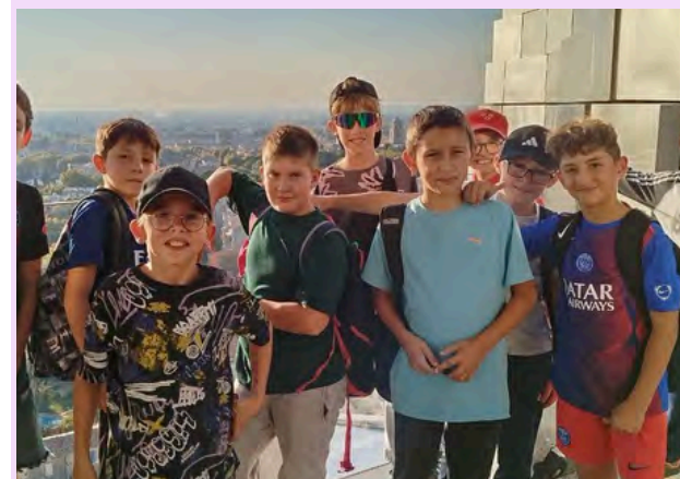
Visite de la ville d'Arles

Jeudi matin, après le petit-déjeuner, ils ont visité les arènes d'Arles et ont profité d'un combat de gladiateurs. L'après-midi, ils ont fait un jeu de piste dans cette ville du Sud de la France. Le soir, ils se sont bien amusés lors de leur « boom ».