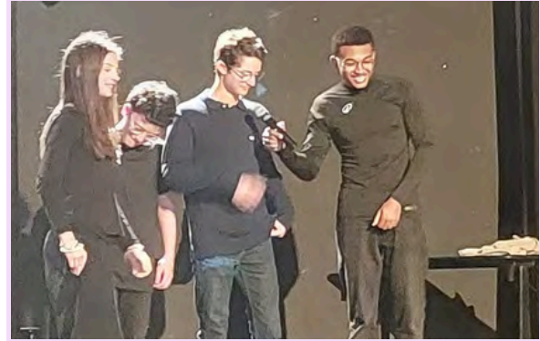
Photo de la représentation de la Métamorphose de Kafka par les élèves germanistes