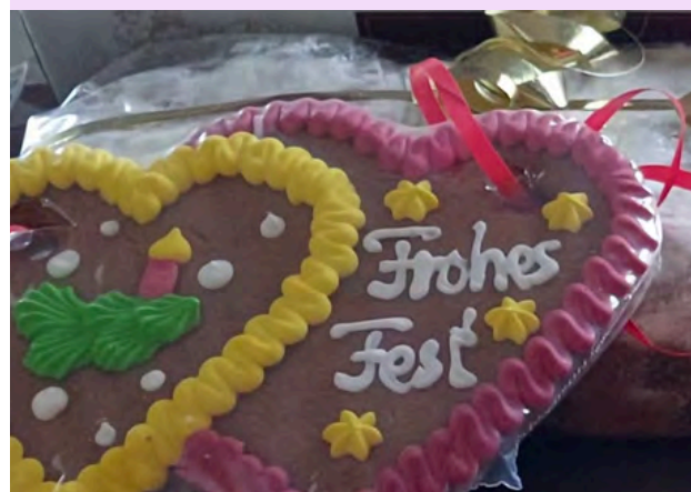
Photo de spécialités culinaires allemandes de Noël offertes à sa famille d'accueil. J. WENZEL