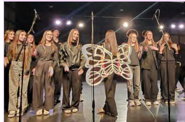
Photo d'une élève avec les ailes de papillon avec les chanteurs