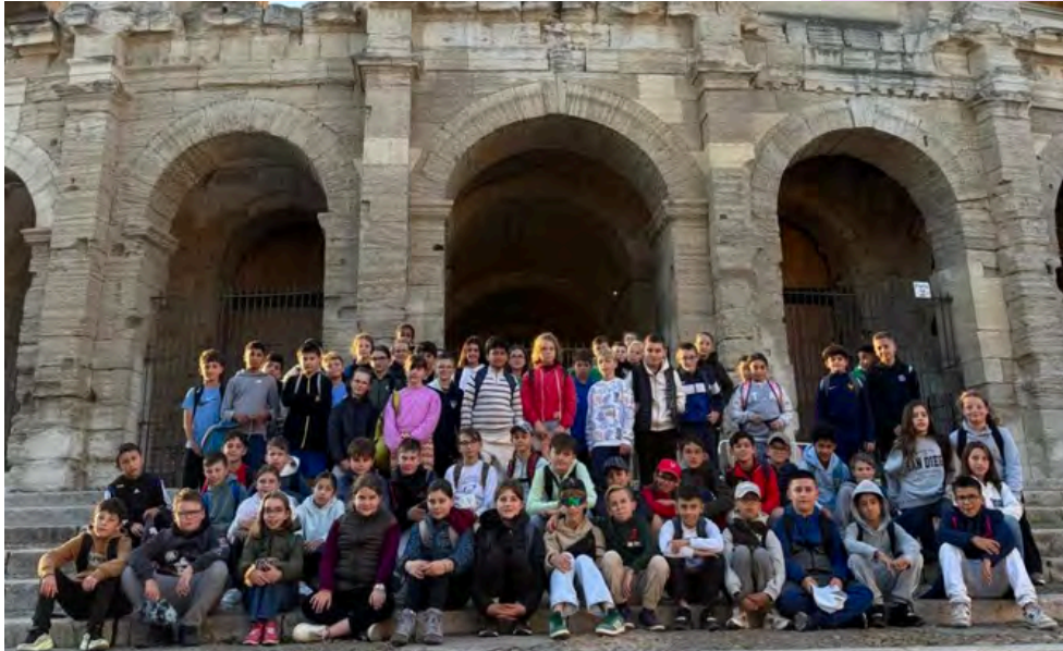
Photo de groupe prise aux arènes d'Arles.

Du mercredi 15 au vendredi 17 octobre 2025, les élèves de sixième ont participé à un voyage scolaire en Provence.