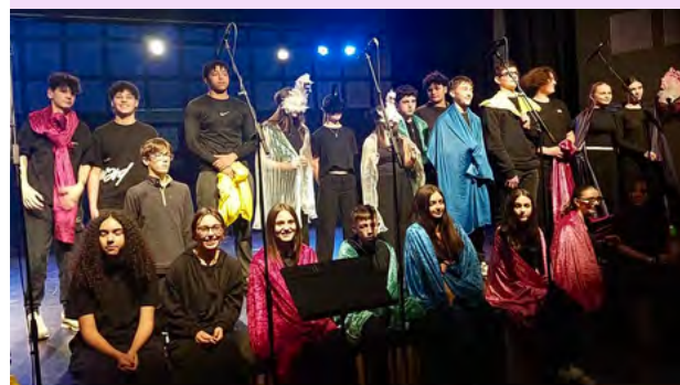
Photo de groupe après une chorégraphie

Les chants ont alterné avec des danses, des chorégraphies d'acroport et des mises en scène.