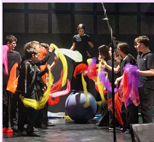
Chorégraphie en acroport