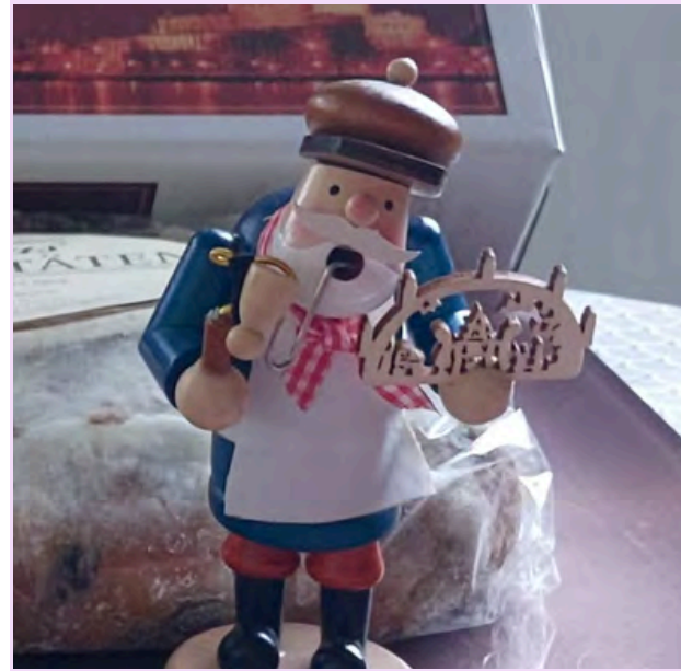
Photo du Räuchermännchen offert à sa famille d'accueil.