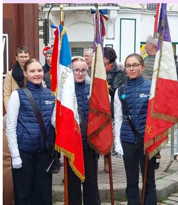
Photo des élèves porte-drapeaux à la cérémonie du Puy-en-Velay le 11 novembre 2025. F.DEFIX