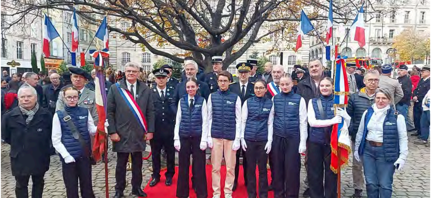
Photo des élèves représentant le collège à la commémoration du 11 novembre 2025 au Puy-en-Velay aux côtés des officiels