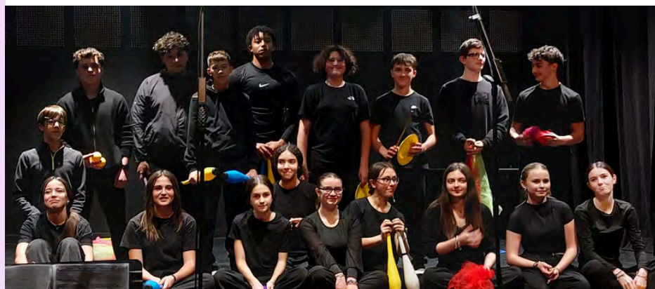
Lors de la représentation intitulée "Métamorphose"